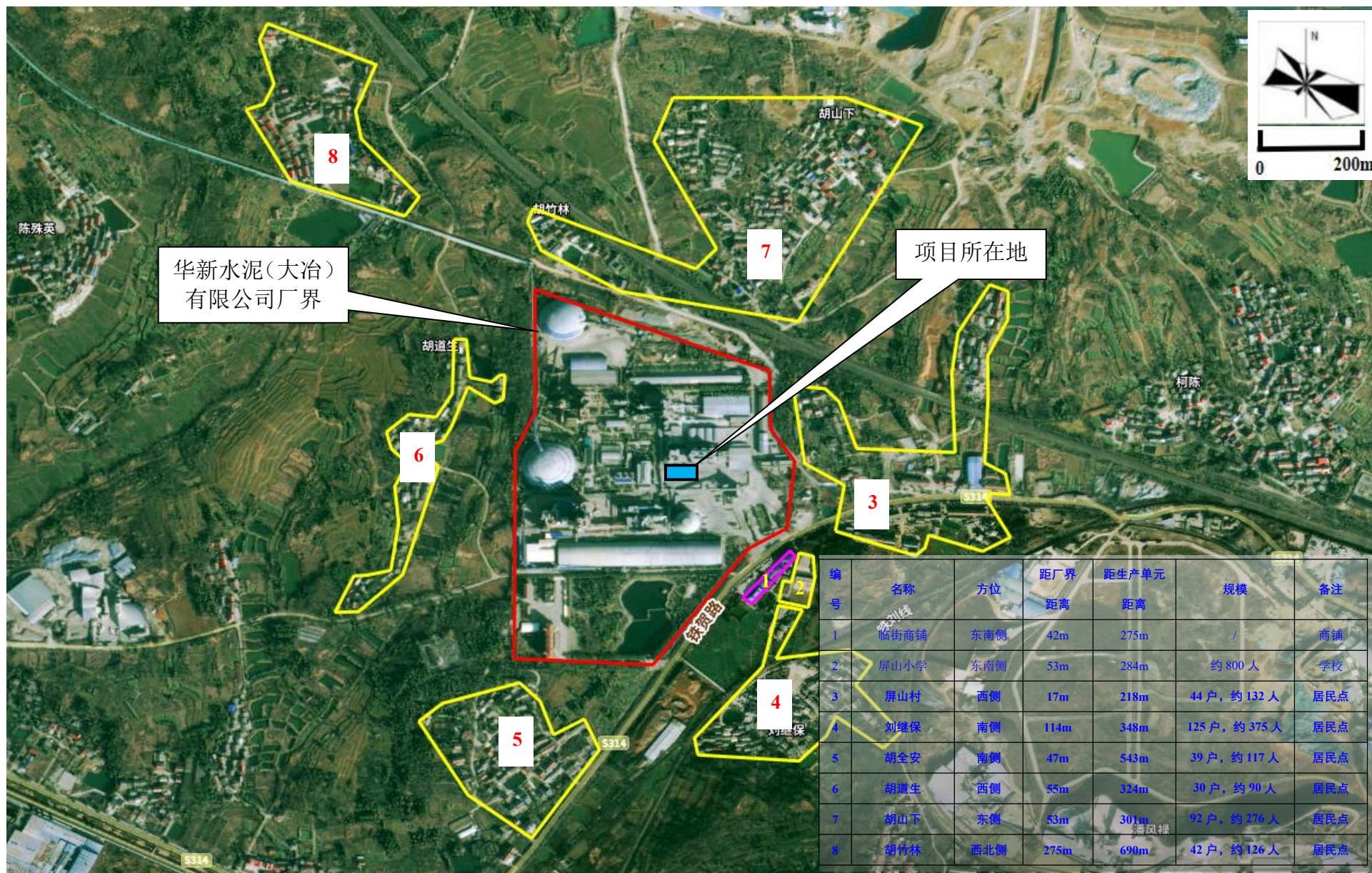
附图 2 项目周边关系示意图