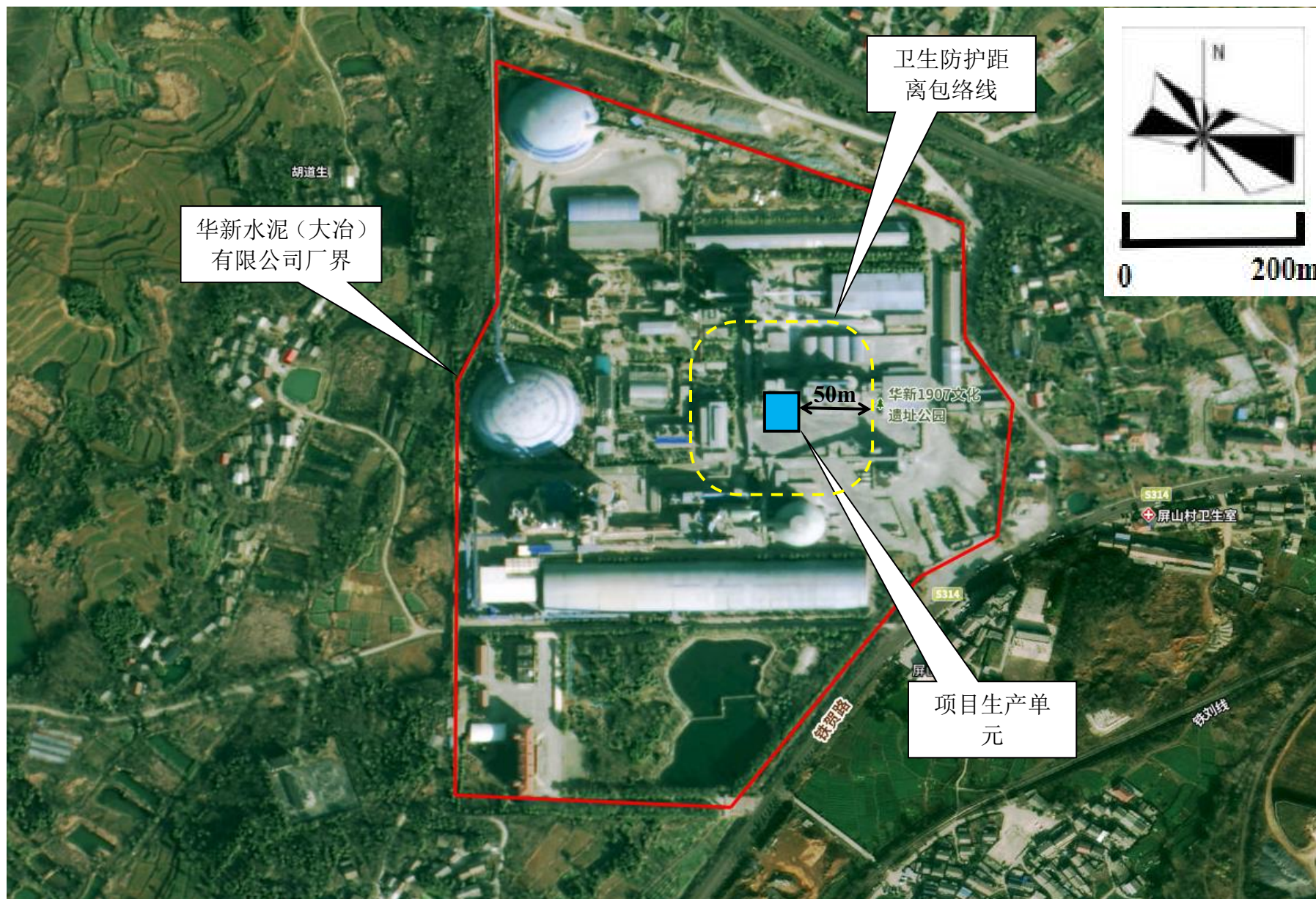
附图3 项目卫生防护距离示意图