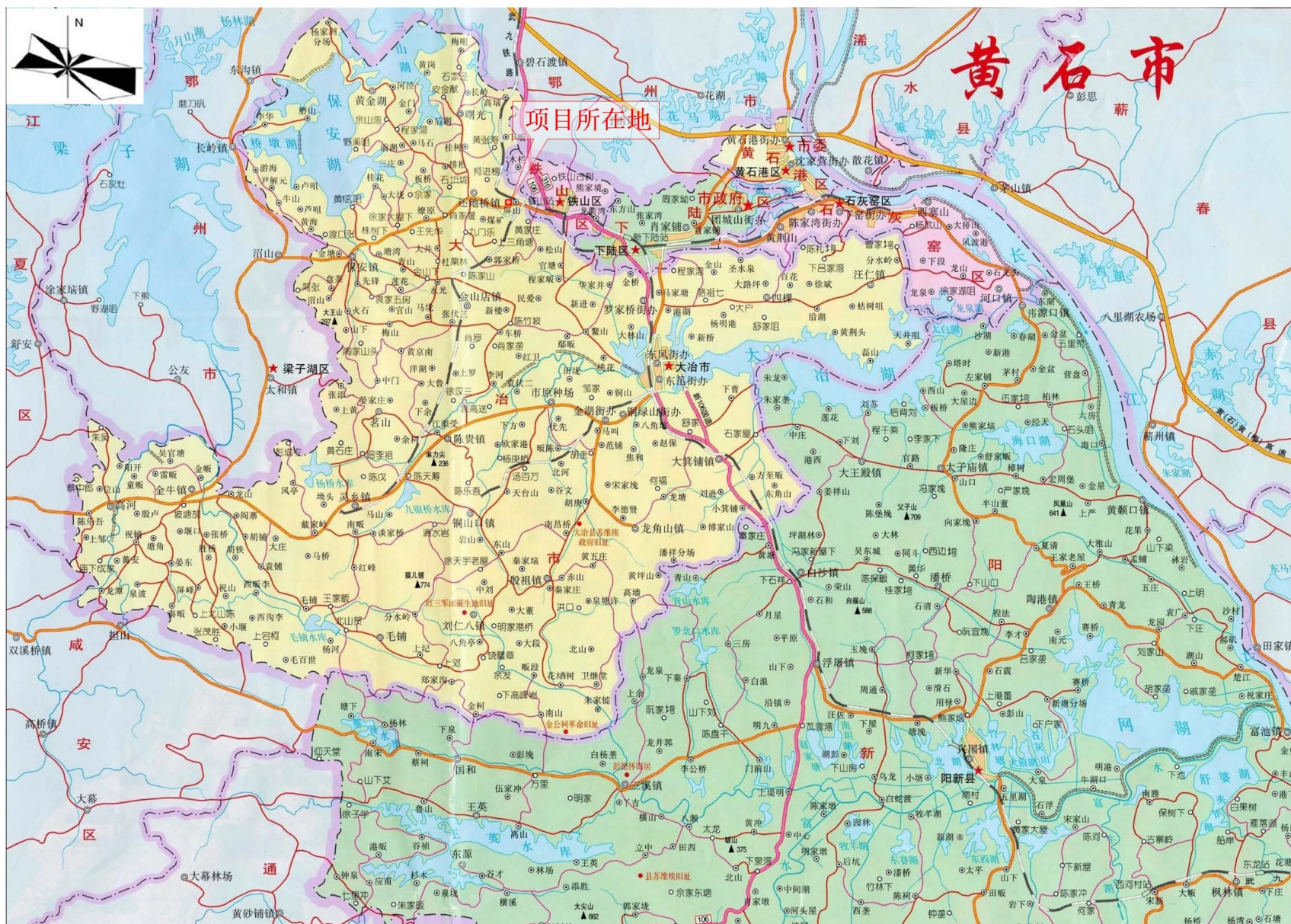
附图1 项目地理位置图